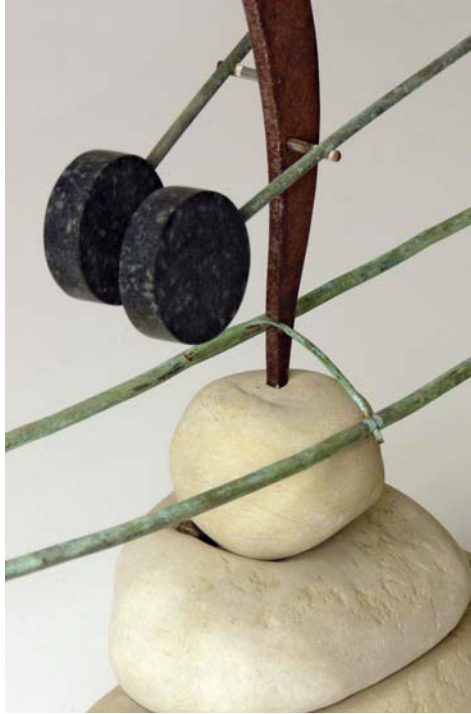
Boot | Modell | Detail