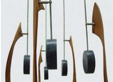
Fünf Gräser | Detail