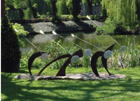
Burg Hülshoff 2008