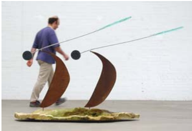
Zwei Federn | Rolf Stahr Sandstein, Stahl, Edelstahl, Kupfer, Diabas