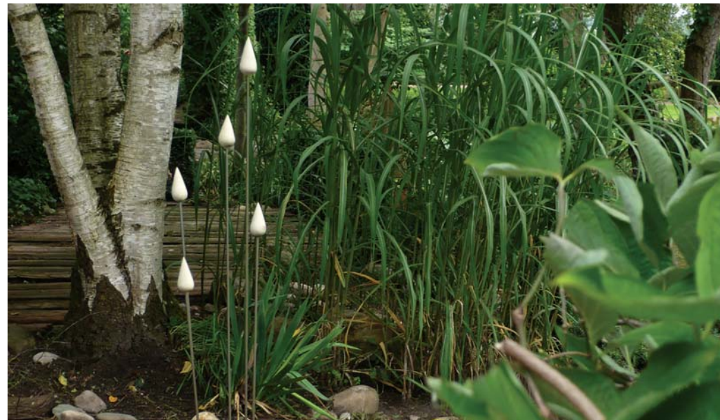
Wachsen 4 | Trau Basalt, Edelstahl, Sandstein