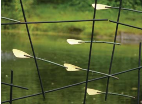
Galerie im Mertenshof 2009