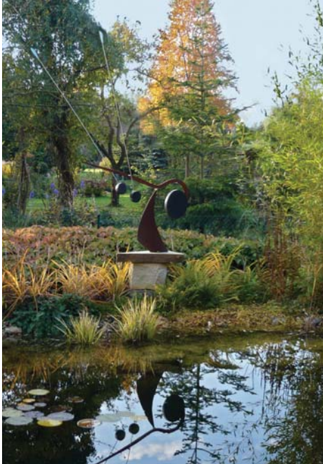
Federwaage | Stahr Stahl, Edelstahl, Diabas, Kupfer