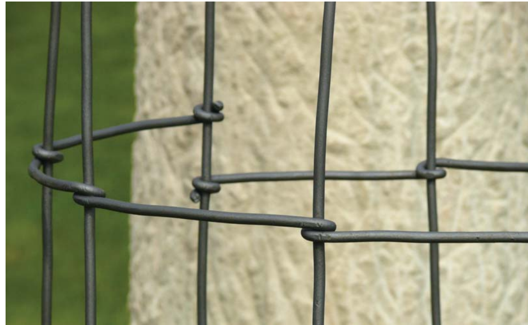
Begegnung | Trau