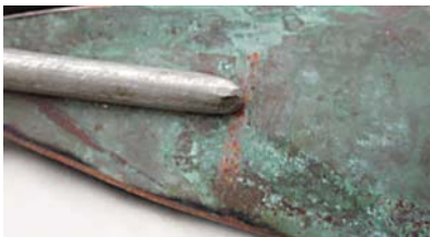
Horn | Stahr Sandstein, Edelstahl, Kupfer, Diabas