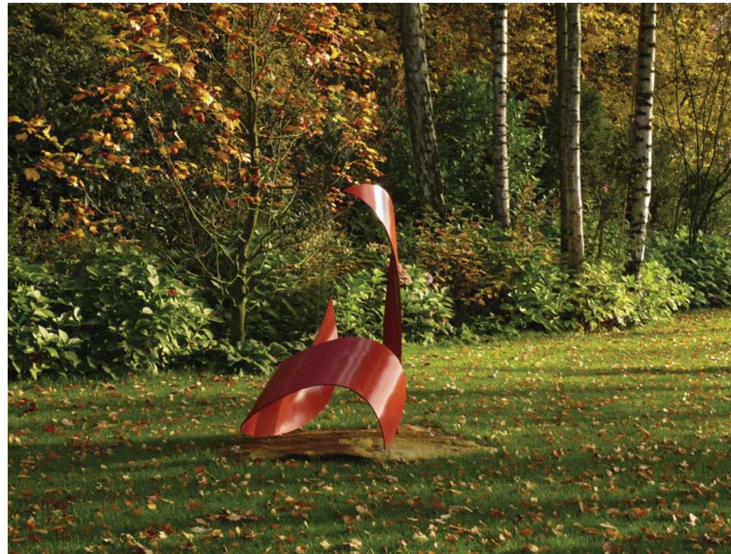
Rote Form | Stahr Stahl lackiert