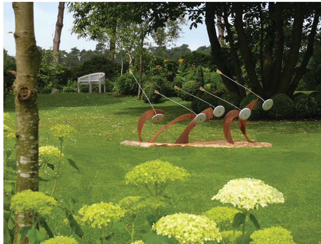
Wellenreiter | Stahr Sandstein, Stahl, Kupfer, Granit, Messing