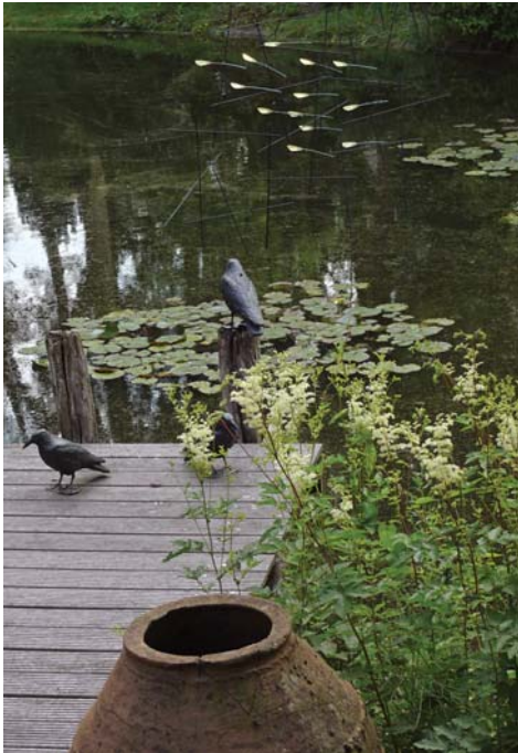
Schwärmen | Stahr/Trau Messing, Kupfer, Stahl lackiert