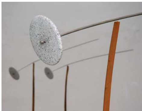
Fünf | Stahr Edelstahl, Granit, Stahl