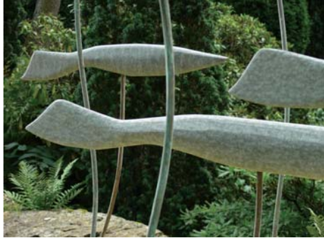
Fischzug | Detail