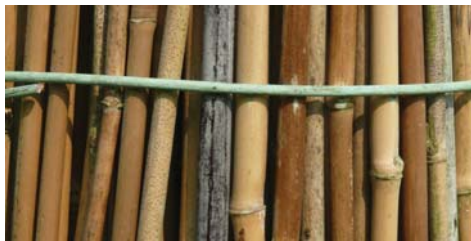
Sandstein, Eisendraht, Kupferdraht, Bambus