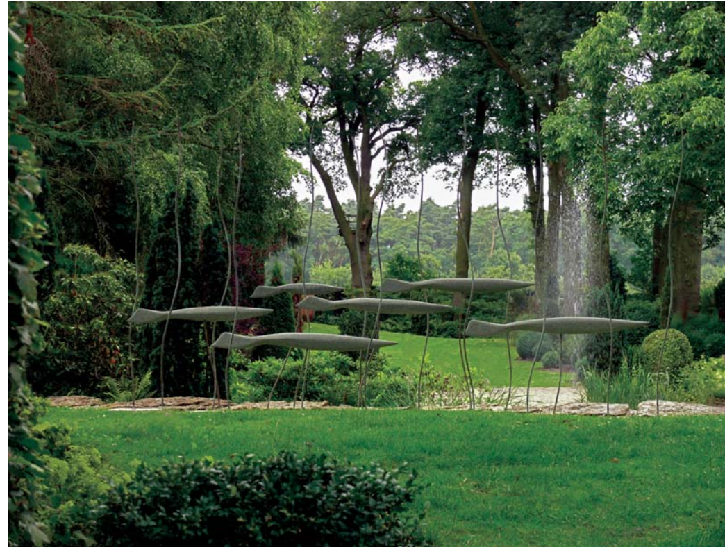
Fischzug | Stahr Kupfer, Diabas