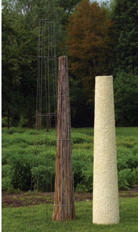
Hamm | Maximilianpark 2009