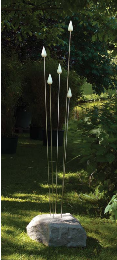
Galerie im Mertenshof 2009